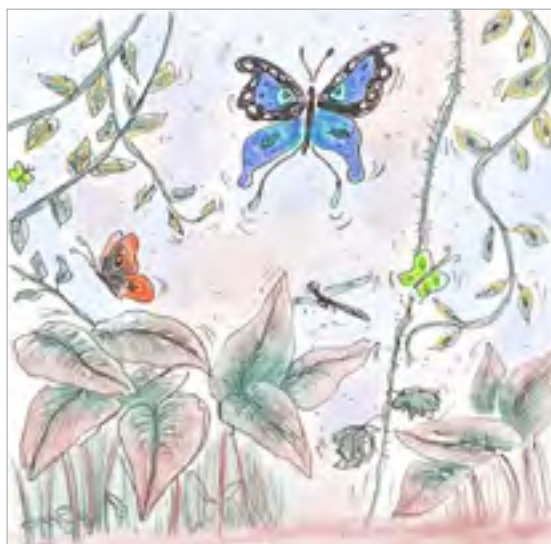
ILLUSTRATION 13 - Persistances bleues

Cette guérison subite donne une sensation de confiance immédiate éphémère qui se prolonge dans une sensation plus profonde qui dure : « Un soulagement dépend des visions rejoignant un même flot comme une substance bleue, la narration et les sensations férocement viscérales qui réapparaissent dans des rythmes similaires à des vagues avec le fredonnement divin du chamane, le fredonnement du monde éveillé » (Taussig, 2021, p. S 34). Les « maîtres de la nuit » (De Rosny, 1981) camerounais sont aux affûts du vivant en latence dans leurs processus de traitements, accueillant des patients qui arrivent discrètement dans la noirceur à l'écart des regards du monde colonial qui se méfie de ces pratiques depuis leur arrivée. Dans ses pratiques, le guérisseur navigue à travers les ambivalences du vivant indépendamment des doses ou des substances, misant sur le souffle, ses vitesses et ses lenteurs.