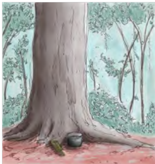
ILLUSTRATION 6 - Apaisements d'ocre rouge