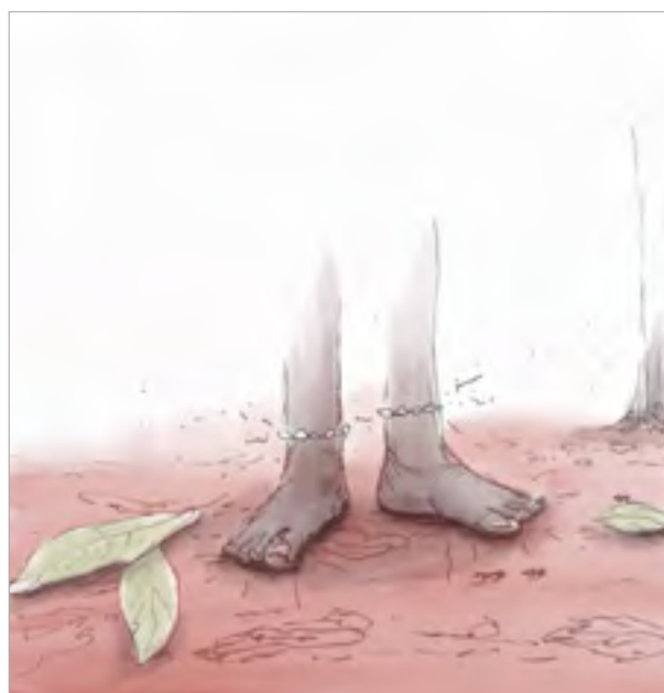
ILLUSTRATION 1 - Ancrages d'ocre rouge

Début août 2022. Nous descendons de l'avion au milieu de la nuit et sommes accueillis par nos hôtes pour entamer un séjour de trois semaines. En quittant l'aéroport, la route cahoteuse et fissurée est difficilement navigable pour la petite voiture surchargée qui nous amène jusqu'au siège de l'Association pour la recherche en anthropologie de la médecine traditionnelle (ARAM), dans le quartier Étoa en périphérie de Yaoundé. Le chemin de terre rouge argileuse, sec et poussiéreux, s'infiltré, s'intègre et se mélange à tous ceux qui parcourent et habitent ces milieux.