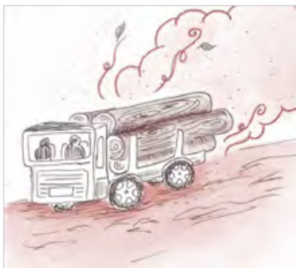
ILLUSTRATION 3 - Excès d'ocre rouge

Les brumes d'argile s'élèvent, se posent et se collent aux plantes tout au long des chemins. Les motos et les voitures se couvrent d'un film de terres rouges cumulatif. Des camions transportant d'énormes troncs d'arbres ancestraux de plusieurs mètres de diamètre défilent constamment. Plusieurs d'entre eux ont pour destination un vaste terrain défriché juste en haut du chemin de terres rouges du siège de l'ARAM; une industrie en expansion qui augmente l'exposition à l'air des terres rouges volatiles en ville et en forêt. Cette terre argileuse et siliceuse mise à découvert, ou le pigment minéral naturel coloré par ses oxydes de fer en haute teneur excite, embaume et rend l'air camerounais quasi perceptible.