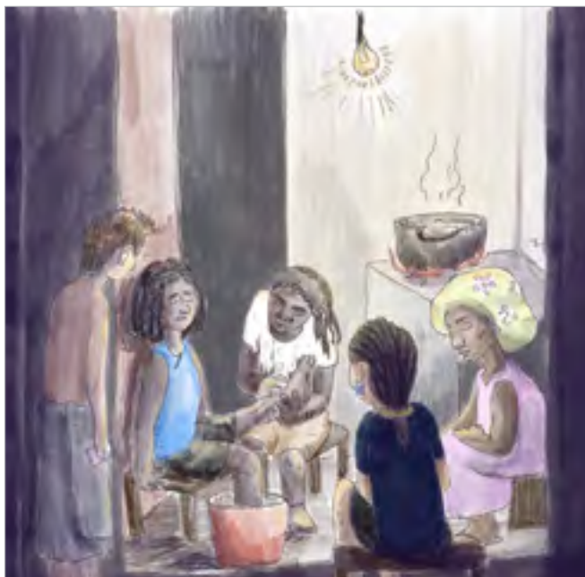
ILLUSTRATION 10 - Songes semi-éveillés violacés