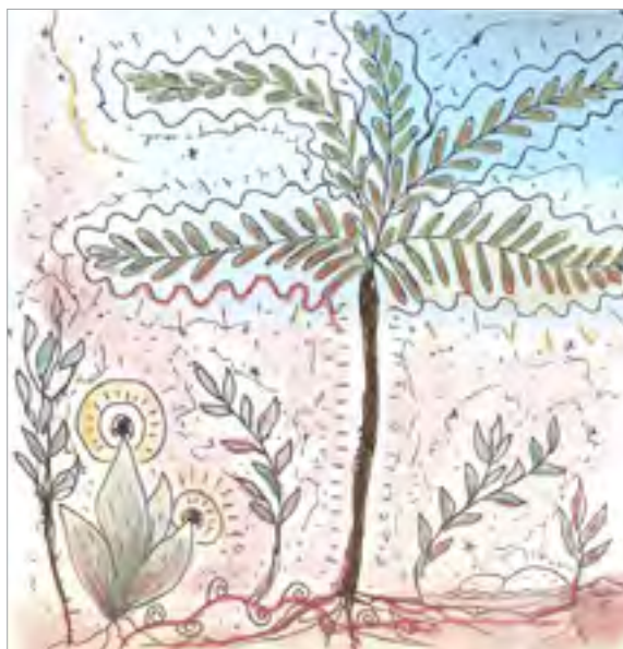
ILLUSTRATION 2 - Evols d'ocre rouge

Les brumes d'argile s'élèvent, se posent et se collent aux plantes tout au long des chemins. Les motos et les voitures se couvrent d'un film de terres rouges cumulatif. Des camions transportant d'énormes troncs d'arbres ancestraux de plusieurs mètres de diamètre défilent constamment. Plusieurs d'entre eux ont pour destination un vaste terrain défriché juste en haut du chemin de terres rouges du siège de l'ARAM; une industrie en expansion qui augmente l'exposition à l'air des terres rouges volatiles en ville et en forêt. Cette terre argileuse et siliceuse mise à découvert, ou le pigment minéral naturel coloré par ses oxydes de fer en haute teneur excite, embaume et rend l'air camerounais quasi perceptible.