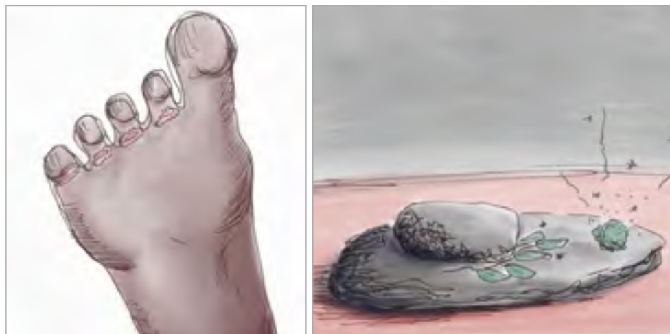
ILLUSTRATION 11 ET 12 - Verts et rouges éphémères

Cette guérison subite donne une sensation de confiance immédiate éphémère qui se prolonge dans une sensation plus profonde qui dure : « Un soulagement dépend des visions rejoignant un même flot comme une substance bleue, la narration et les sensations férocement viscérales qui réapparaissent dans des rythmes similaires à des vagues avec le fredonnement divin du chamane, le fredonnement du monde éveillé » (Taussig, 2021, p. S 34). Les « maîtres de la nuit » (De Rosny, 1981) camerounais sont aux affûts du vivant en latence dans leurs processus de traitements, accueillant des patients qui arrivent discrètement dans la noirceur à l'écart des regards du monde colonial qui se méfie de ces pratiques depuis leur arrivée. Dans ses pratiques, le guérisseur navigue à travers les ambivalences du vivant indépendamment des doses ou des substances, misant sur le souffle, ses vitesses et ses lenteurs.